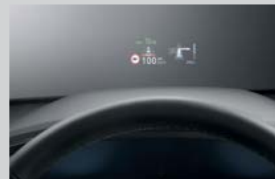
Hiển thị thông tin trên kính lái HUD (Bản Cao cấp)