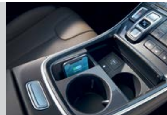
Sạc không dây chuẩn Qi