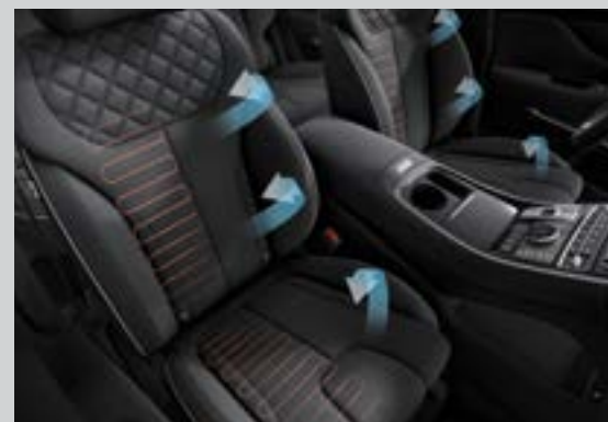
Làm mát và sưởi hàng ghế trước (Bản Đặc biệt và Cao cấp)