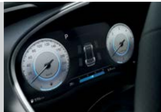
Màn hình thông tin digital 12.35 inch (Bản Đặc biệt và Cao cấp)