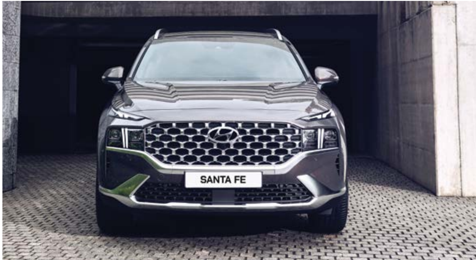
Thiết kế phá cách với lưới tản nhiệt mạ crom to bản Cascading Grill đặc trưng cùng cụm đèn chiếu sáng AHB LED