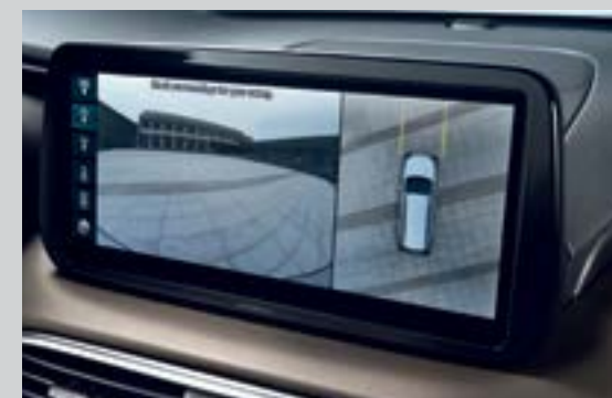
Hệ thống camera 360° (Bản Cao cấp)