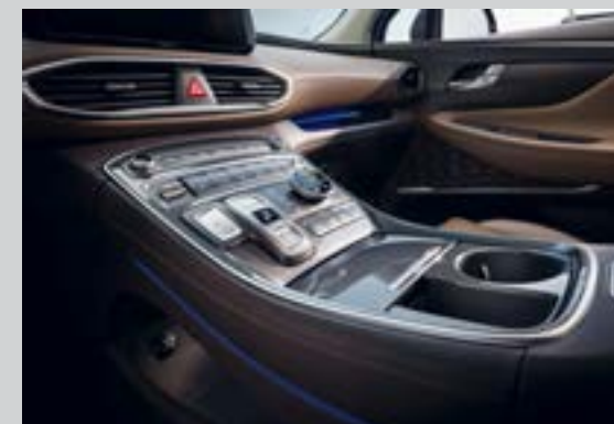
Cần số điện tử dạng nút bấm cùng đèn viền ambient light