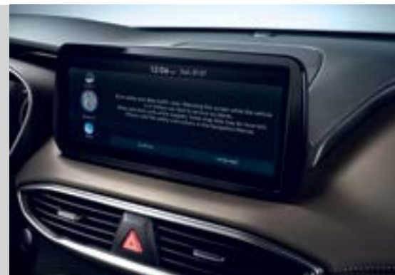
Màn hình giải trí 10.25 inch

Không gian nội thất của New Santa Fe là sự kết hợp hoàn hảo của sự sang trọng cùng với công nghệ hiện đại mang đến cho khách hàng sự tiện nghi thoải mái