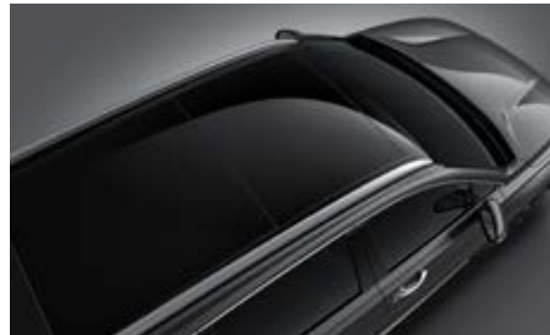
Cửa sổ trời toàn cảnh Panorama cùng thanh treo giá nóc (Bản Đặc biệt và Cao cấp)