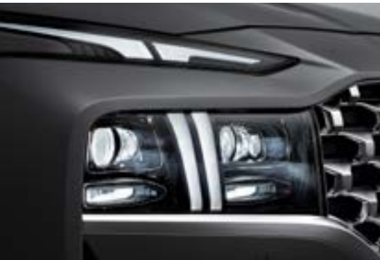
Đèn định vị ban ngày (DRL) tạo hình chữ T kéo từ nắp capo xuống hết cụm đèn chiếu sáng