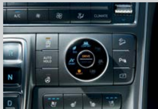
4 chế độ lái (Eco, Comfort, Sport, Smart)