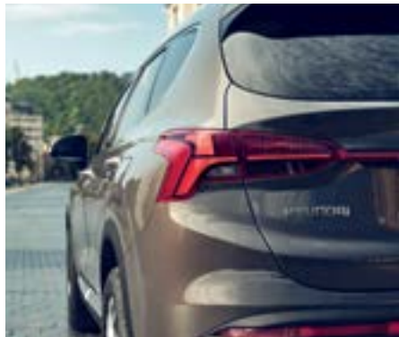
Đèn hậu công nghệ LED 3D